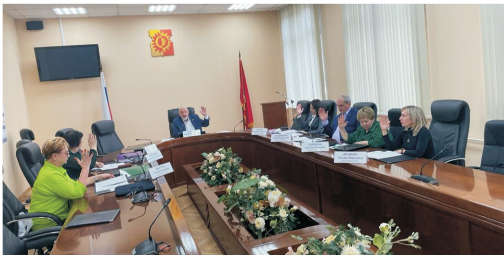
Совет депутатов муниципального округа Солнцево согласовал адресный перечень объектов озеленения