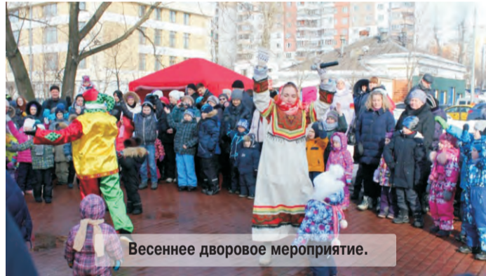
Весеннее дворовое мероприятие.

деятельности являются дети, подростки, молодежь, взрослое население, а так же люди старшего поколения старше 55лет.