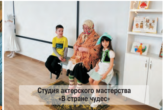
Студия актерского мастерства «В стране чудес»

Предлагаю вашему вниманию отчет об организации досуговой, социально-воспитательной, физкультурно-оздоровительной и спортивной работы с населением района в филиале «Спортивно-досуговый центр «Радуга» государственного бюджетного учреждения города Москвы «Молодежный центр «Галактика» 2022 год.