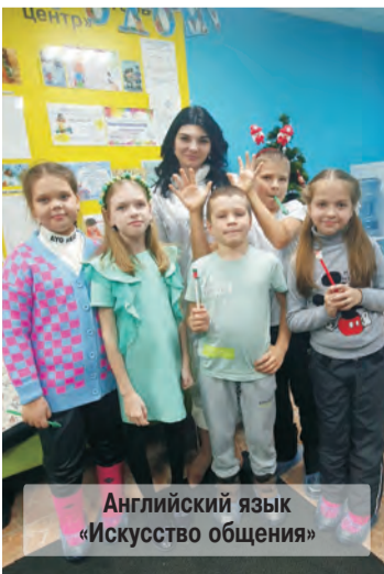
Английский язык «Искусство общения»